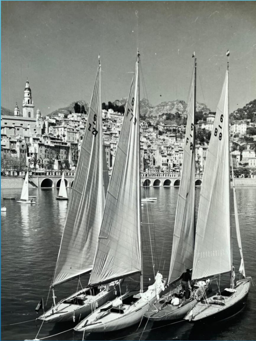
Menton vieux port 1958