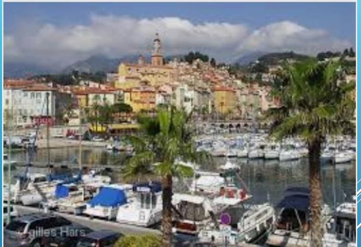
Menton vieux port 2018